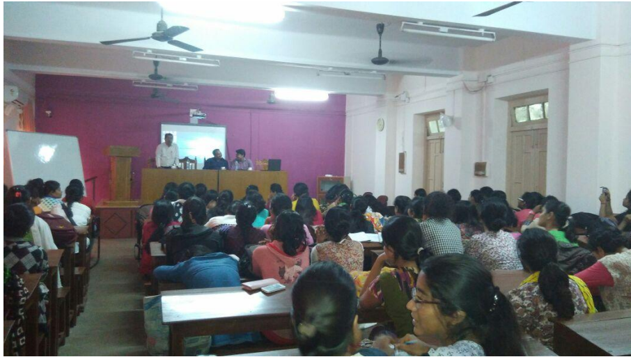
Figure 1 ILEAP OFFICIALS AND TRAINERS ARE DELIVERING LECTURES