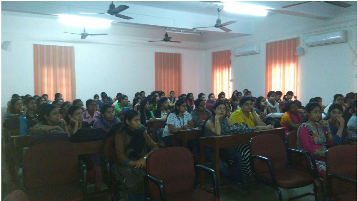
Figure 3 STUDENTS LISTENING ATTENTIVELY IN ILEAP WORKSHOP